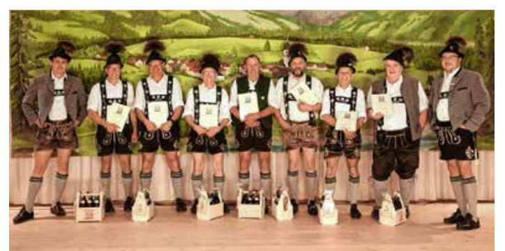
Bilder von den Geehrten